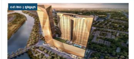
គម្រោង The Peak កំពុងស្ថិតក្នុងភាពចម្រៀងចម្រាស់ជាមួយគ្រុឌហ៊ុនម៉ែត្រស្រស់ស្អាត