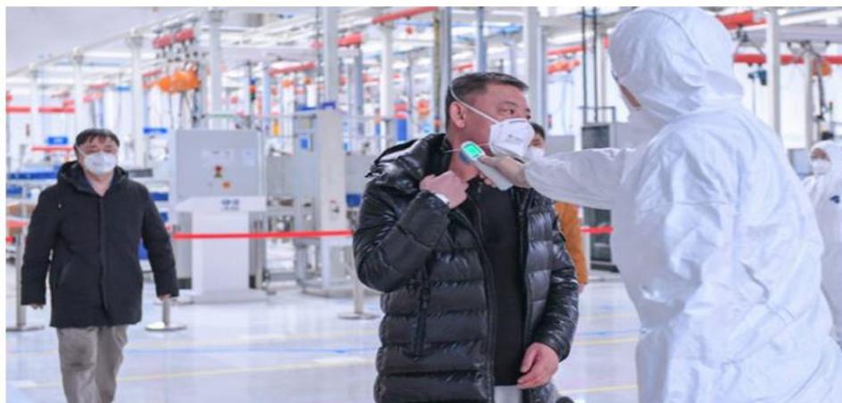
ការផ្ទុះឡើងនៃមេរោគឆ្លងថ្មី COVID-19 នៅក្រៅប្រទេសចិនដីគោកបានបន្តរីករាលដាលកាន់តែខ្លាំងឡើងៗ ខណៈអ្នកជំនាញបានព្រមានថា យើងអាចនឹងឈានដល់កម្រិតភាគតកទាំងពិភពលោក ។