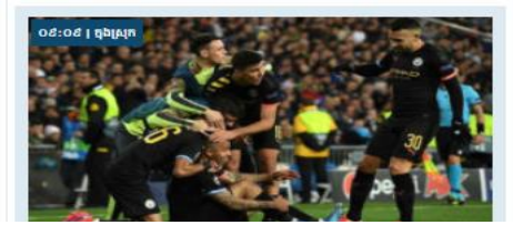
០៩:០៩ | ក្នុងស្រុក

ក្រុមការងាររបស់អង្គការសុខភាពពិភពលោកបានចុះចតនៅប្រទេសអ៊ីតាលីកាលពីថ្ងៃច័ន្ទ ដើម្បីគាំទ្រអាជ្ញាធរអ៊ីតាលីក្នុងការស្វែងយល់អំពីស្ថានភាពនេះ។ ការផ្តោតអារម្មណ៍របស់ក្រុមនឹងផ្តោតលើ ការដាក់កម្រិតលើការឆ្លងពីមនុស្សទៅមនុស្ស បន្ទាប់ពីមានការកើនឡើងយ៉ាងឆាប់រហ័សនូវចំនួនករណី។ យ៉ាងហោចណាស់មានមនុស្ស ២៧២នាក់បានឆ្លងវីរុសនេះ ហើយមនុស្ស ៧នាក់បានស្លាប់នៅក្នុងប្រទេសនៅអឺរ៉ុបខាងត្បូង។