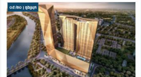
គម្រោង The Peak កំពុងស្ថិតក្នុងភាពចម្រើនចម្រាប់ជាមួយក្រុមហ៊ុនទៅការសំណង់

ជំងឺដែលឆ្លងតាមខ្យល់មានជំងឺ ឬមេរោគរបេង មេរោគស្លូត កញ្ចិល អុតស្វាយ ។ លោកវេជ្ជបណ្ឌិតបន្តថា មេរោគឆ្លងតាមខ្យល់នេះ ទោះបីជាកំម៉ាស់យ៉ាងណាក៏មិនអាចការពារបានដែរ គឺវាអាចច្រេះចូលតាមប្រហោងតាមម៉ាស់ធំជាង ប៉ុន្តែអាចការពារបានទាល់តែពាក់ម៉ាស់របស់ពេទ្យបានទប់ជាប់ ។ ចំពោះការឆ្លងតាមដំណកទឹកតូចៗវិញមានន័យថា នៅពេលដំណកទឹកតូចៗចេញពីអ្នកជំងឺដល់កន្លែងណាមេរោគដល់ទីនោះជាក់ស្តែងមានជំងឺខាន់ស្លាក់ ជំងឺផ្តាសាយ និងកូរ៉ូណាវីរុសជាដើម ។ លោកបញ្ជាក់ថា «ពេលដំណកទឹកតូចៗដល់ទីណាមេរោគទៅដល់ទីនោះ ។ ដំណកទឹកនឹងកើតមកពីការក្អកកណ្តាល ។