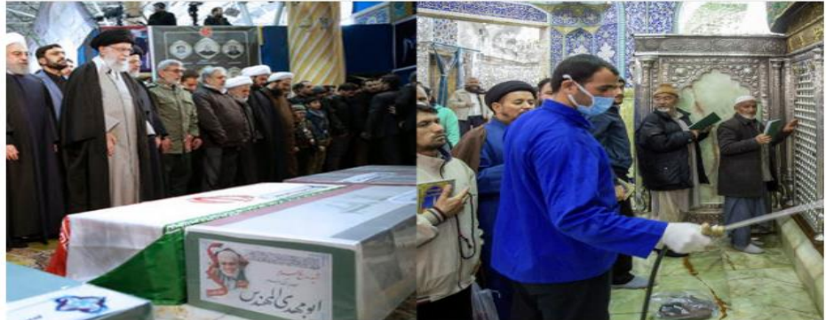
ជម្លោះរវាងសាសនានិងវិទ្យាសាស្ត្រពីវីរុស covid-19 ដែលកំពុងតែរាលដាលក្នុងប្រទេសអ៊ីរ៉ង់

Home > KPT Plus > ជម្លោះរវាងសាសនានិងវិទ្យាសាស្ត្រពីវីរុស Covid-19 ដែលកំពុងតែរាលដាលក្នុងប្រទេសអ៊ីរ៉ង់