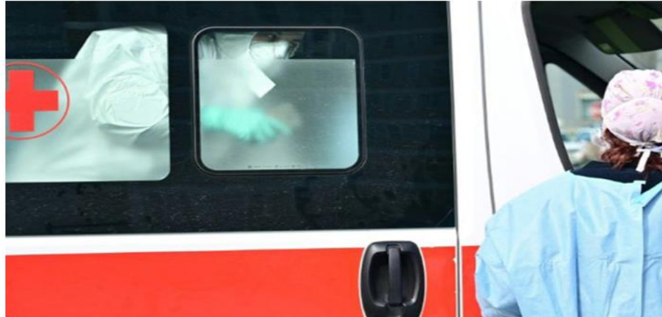
ប្រទេសអ៊ីតាលី ៖ អ៊ីតាលី ប្រទេសដំបូងជាប្រភពនៃការចម្លងវីរុស COVID-19 នៅអឺរ៉ុប ដែលចំនួនអ្នកបាត់បង់ជីវិតមកដល់ថ្ងៃទី៤៧ ឡើងដល់លើសពី១០០នាក់ គឺ១០៧នាក់ ក្នុងចំណោមអ្នកឆ្លងឡើងដល់៣.០៨៩នាក់ បានចាត់បណ្តាវិធានការវិសាមញ្ញនានា ដោយបណ្តាសាលារៀននិងសាកលវិទ្យាល័យត្រូវបិទទ្វារចាប់ពីថ្ងៃទី៥៧នាទៅរហូតដល់ថ្ងៃទី១៥មីនា។

នាយករដ្ឋមន្ត្រី អ៊ីតាលី លោក GIUSEPPE CONTE ពុំបដិសេធឡើយដែលថា បណ្តាមន្ទីរពេទ្យអាចមានអ្នកជំងឺប្តូរចូលលើសចំណុះ ក្នុងករណីមានកំណើនខ្ពស់នៃអ្នកជំងឺដែលធ្ងន់ធ្ងរ។ លោកបានព្រមានថា ពុំមែនប្រទេស អ៊ីតាលី តែមួយទេ ទោះប្រទេសណាមួយនៃពិភពលោកក៏អាចប្រឈមមុខនឹងសភាពការណ៍បែបនេះដែរ។