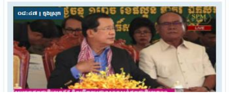
០៨:៤៧ | ព្រឹត្តិការណ៍