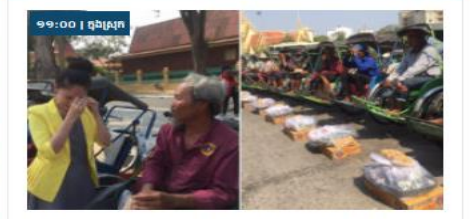
ទឹកចិត្តប្រពៃម្នាក់ៗ គ្រប់គ្រង ចែកអំណោយថ្ងៃទី៤៧ រំដួលចិត្តប្រពៃម្នាក់ៗ